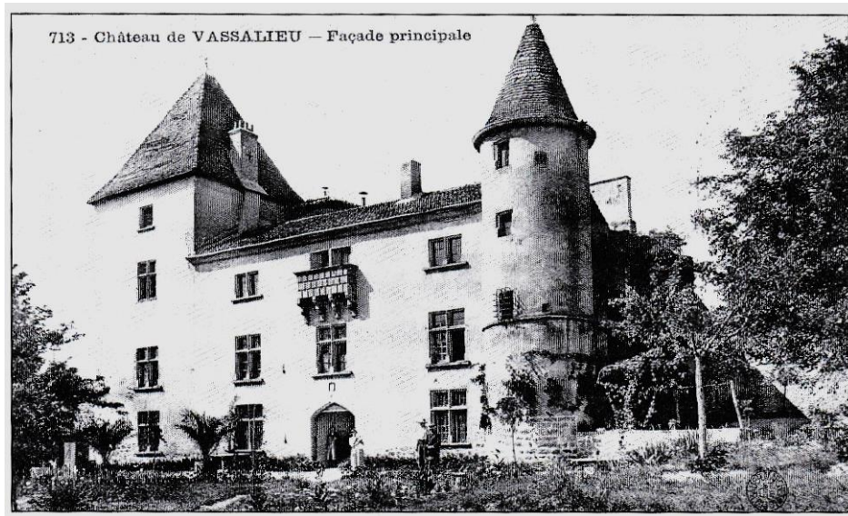
Carte postale ancienne

E. Salomon donne la description suivante du château :