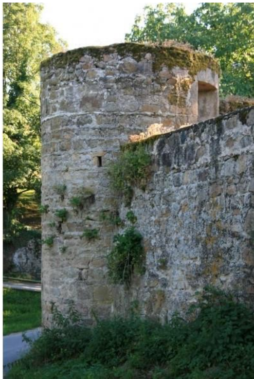
Elément du mur d'enceinte médiéval