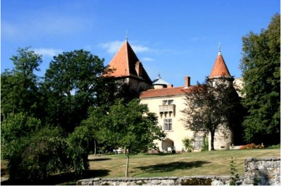
Façade est