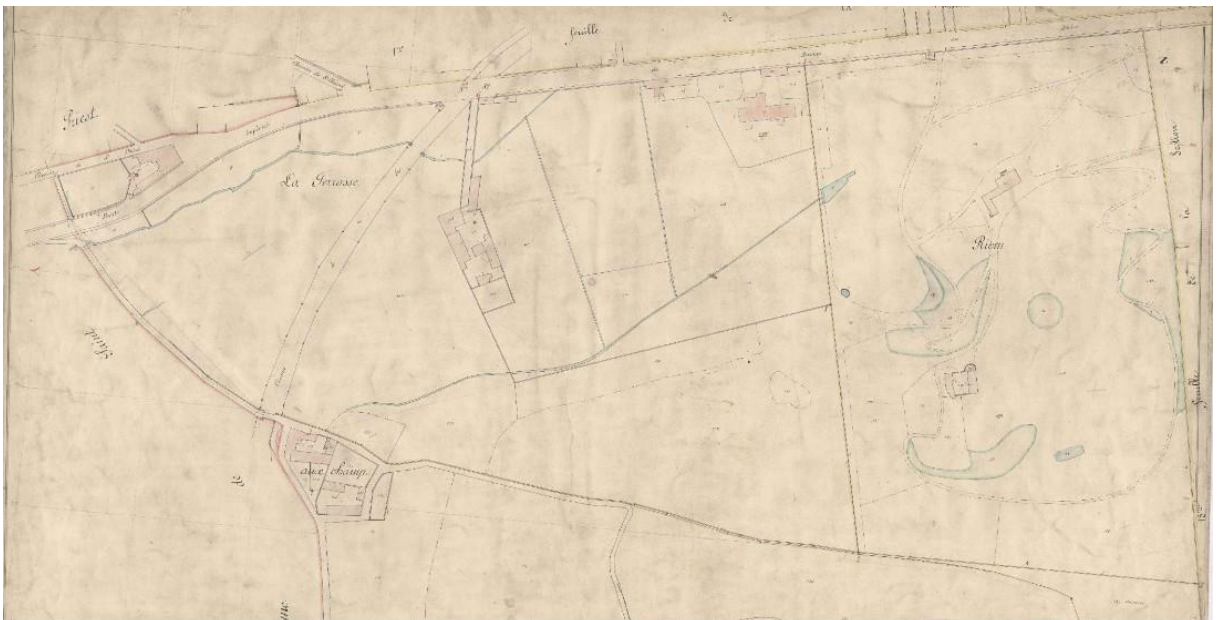
La propriété figure sur la droite du plan