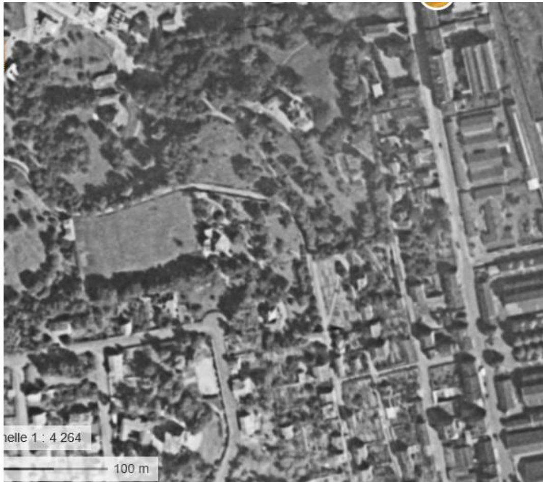
Le château et son parc dans la partie supérieure de la photo aérienne (vers 1950)

Outre ces terrains entre l'actuelle rue Théophraste Roussel et Michel Laval, tout le secteur construit dans les années 60 du Clos Fleuri devait appartenir à la famille Lyonnet 2 .