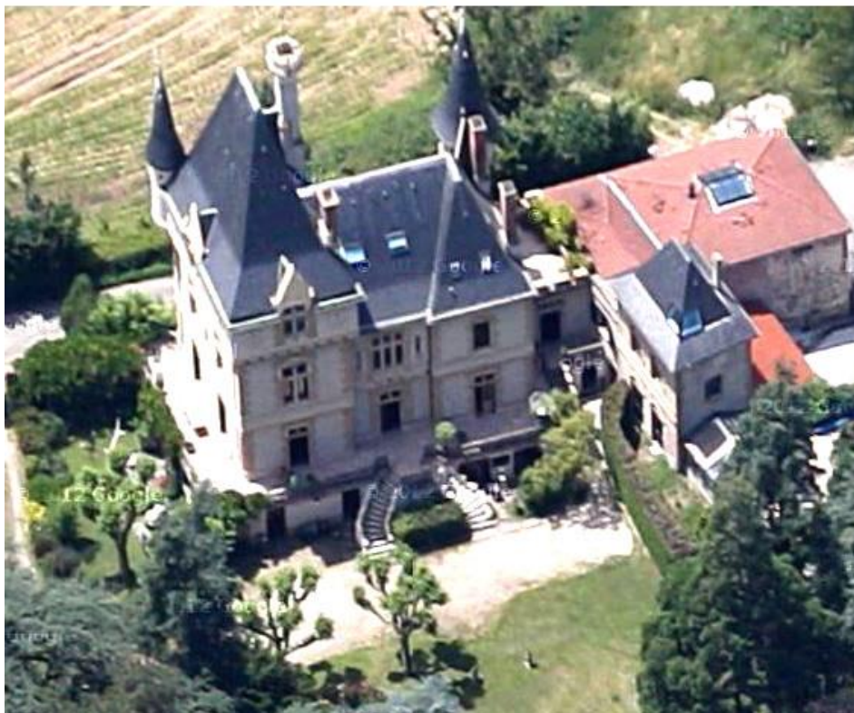
Vue aérienne sur la façade est

La re-construction du château, qui date de 1885, est due à l'architecte Durand qui réalisa divers immeubles de négociants à Saint-Etienne dans les années 1880-1900. L'édifice est situé dans un parc de 8 ha.