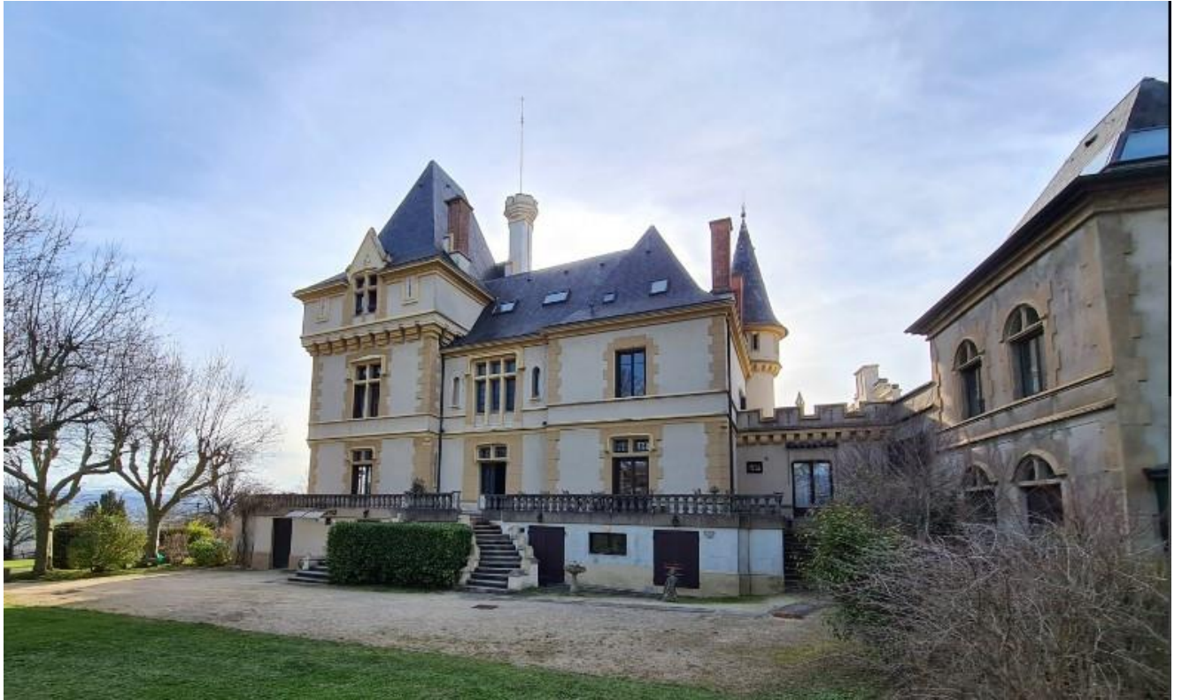
Façade est. Escalier monumental donnant accès à une terrasse. Bâtiment des communs à droite

La construction, accolée aux anciennes dépendances, est de facture néo-historique . Elle correspond à un style renaissance très en vogue à cette époque, avec des motifs médiévaux et néo-gothiques qui veulent figurer les attributs d'un château fort. C'est le cas des deux tourelles en cul de four et poivrières, aux deux extrémités de la façade principale. Tout est prétexte à exprimer la puissance par la verticalité volumétrique.