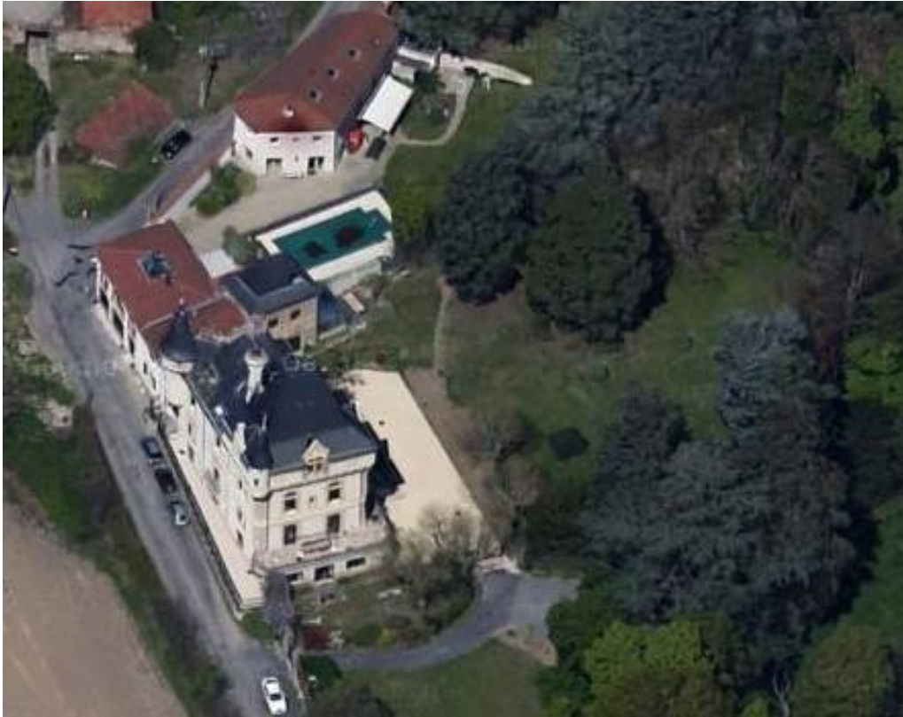
Une composition en forme de L

Un bâtiment annexe qui forme un angle avec l'édifice principal a également été édifié à la même époque. L'ensemble est complété par d'importants bâtiments de ferme.