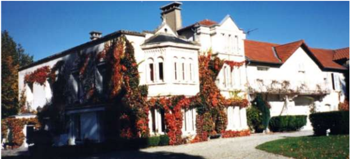
La façade sud vers l'an 2000.