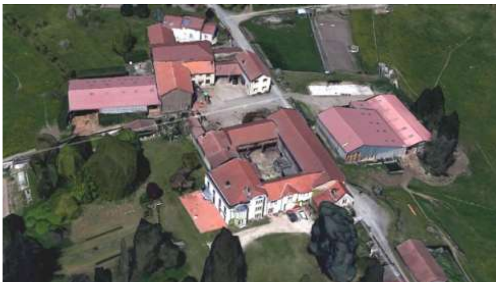
Une composition en quadrilatère présentant une belle façade ouvrant sur le parc

Le bâtiment principal est sans doute assez ancien. D'après J. Sagnard, il remonterait en partie aux XVème et XVIème siècles.