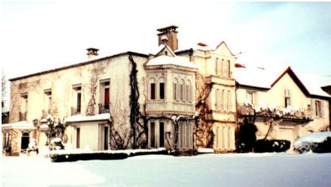
Les façades ouest et sud

La façade ouest avait été traitée beaucoup plus simplement, sans relief apparent. La famille Thiollier lui avait accolé un édifice en bois qui permettait d'accéder directement au 1 er étage et qui masquait le niveau du rez-de-chaussée. On aperçoit son extrémité sur le cliché où figure la famille Thiollier (cf supra).