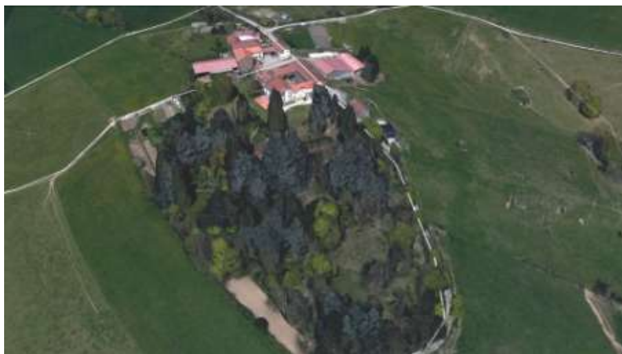
La propriété et son vaste parc

Il s'agit d'une maison de maître située à l'écart, au sud du bourg, dominant les communes de La Fouillouse et de L'Etrat, avec des bâtiments agricoles associés.