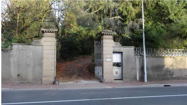
Entrée sur l'avenue A. Ravel