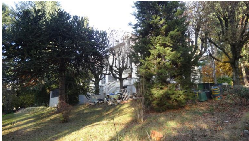
Essences arbustives sur l'allée qui conduit à la maison

La propriété est dotée d'un parc arboré avec de belles essences. Une allée qui conduit au portail situé sur l'avenue A. Ravel.