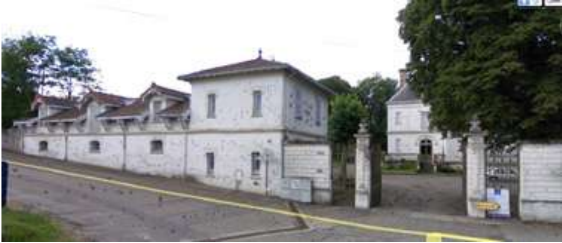
Ecuries et remise, maison de gardien et portail d'entrée

Dans le parc se trouvent un bassin et petit pont traversant un ruisseau artificiel ; une serre, une orangerie et un potager.