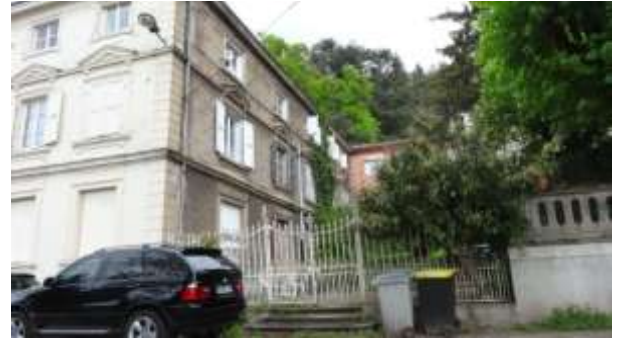
La façade latérale