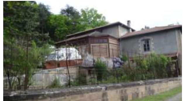
L'arrière des bâtiments de service