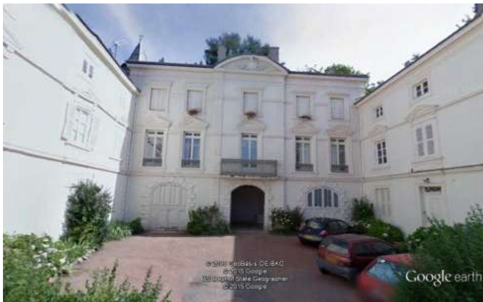
La cour intérieure

L'étendue du parc a été très fortement diminuée. Ce sont surtout les terrains qui font face au château qui ont été vendus et construits, ce qui a privé l'édifice de ses perspectives originelles.