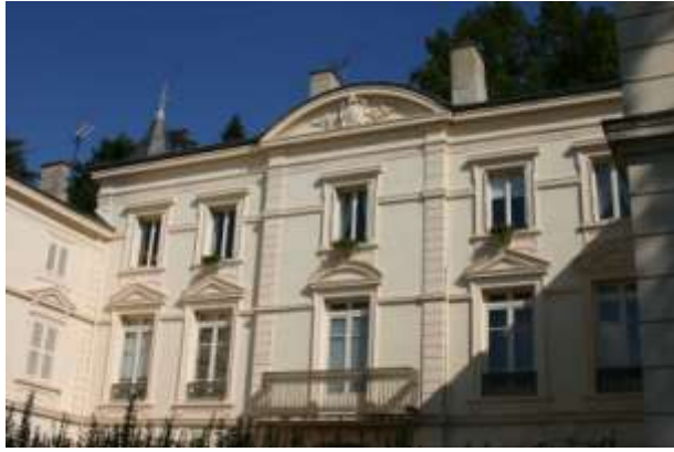
La façade principale