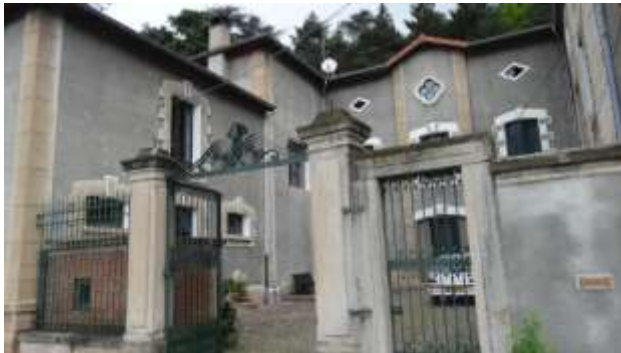
la seconde cour avec les logements du personnel