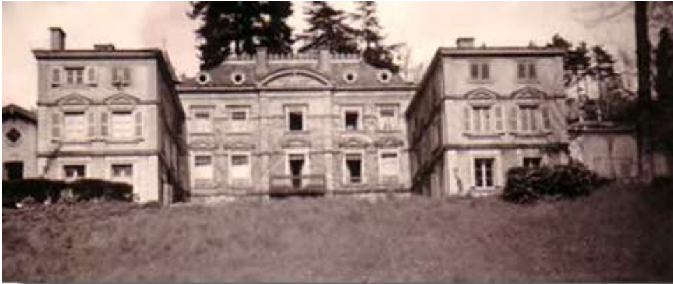
Le château dans son état d'origine vers 1930, avant l'arrivée des lotissements

On ne connaît pas l'architecte qui a réalisé cet édifice. Façade classique et sobre, entourée de deux ailes avancées, selon une belle symétrie. Les éléments de décoration tels les frontons surmontant les fenêtres ou au centre de la façade se réfèrent au style du XVIII e siècle. Les bâtiments ont reçu un enduit blanc qui accentue cette impression, mais qui n'était pas présent à l'origine.