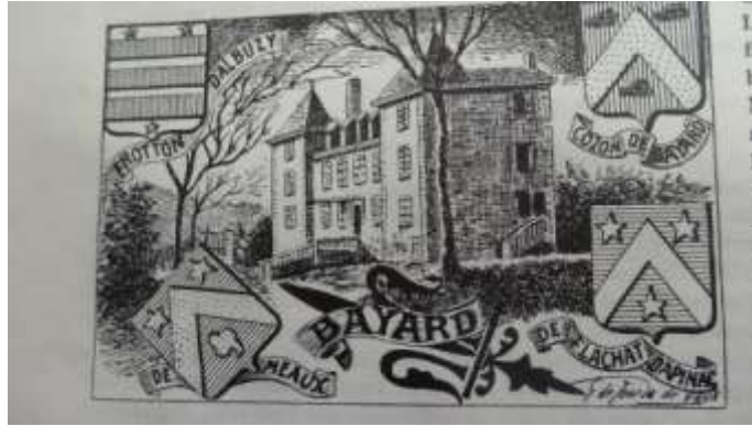
Vignette tirée de l'ouvrage d'E. Salomon, par Jourda de Vaulx