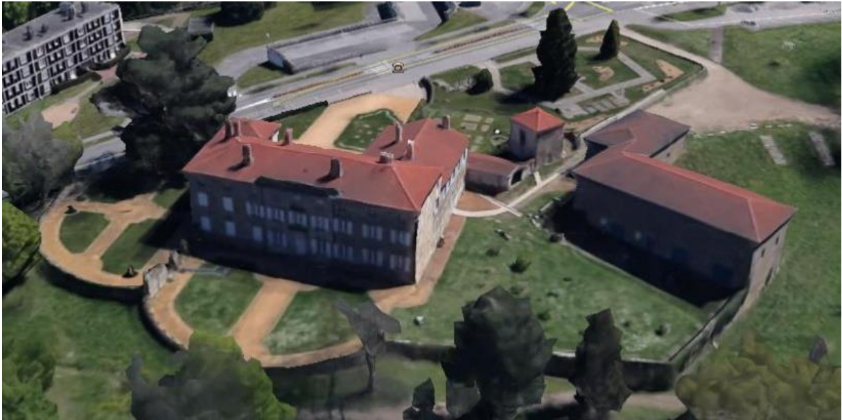
Façade principale, jardins et chapelle

Le bâtiment reconstruit à la fin du XVIII e siècle est de facture néo-classique d'une grande simplicité.