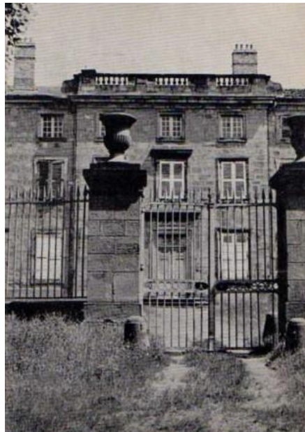
Le château avant sa restauration

Elle est expropriée en 1967, avec projet de démolition du château, afin de permettre la réalisation du quartier de Firminy-Vert. La Société d'Histoire de Firminy créée à ce moment organise alors des actions pour sauvegarder ce patrimoine. Elle obtient l'acquisition du château par la commune en 1972 et l'engagement de procéder à sa restauration.