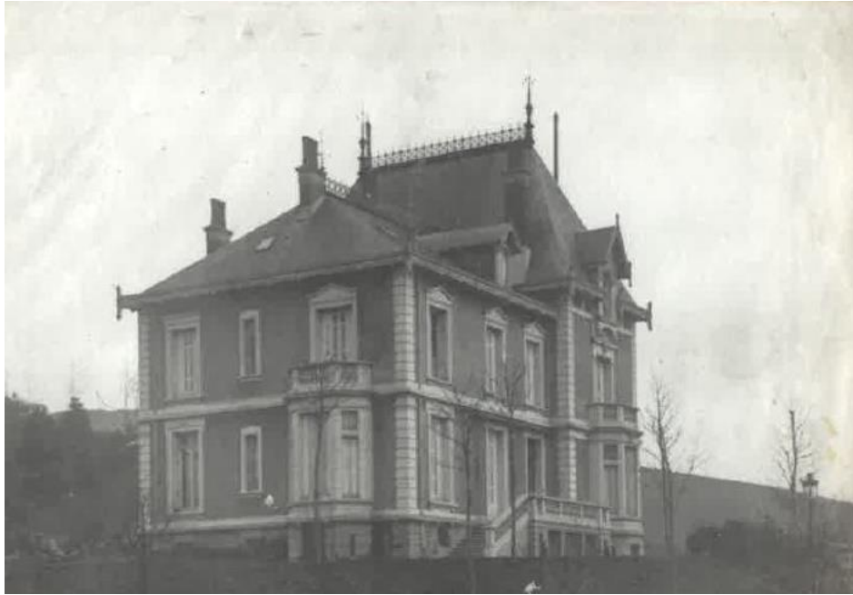
La maison en 1900 isolée dans la campagne.