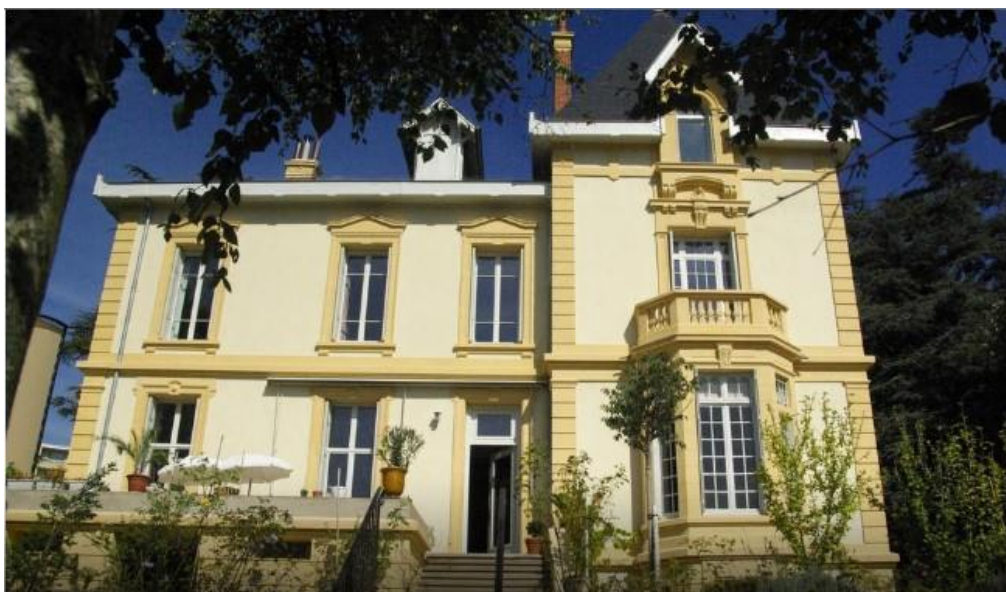
Façade principale

Les photos récentes montrent que cette composition a été modifiée par des travaux qui datent de 1962. L'escalier latéral a été supprimé et remplacé par un escalier central; la terrasse a été réaménagée pour couvrir de nouveaux locaux aménagés en sous-sol.