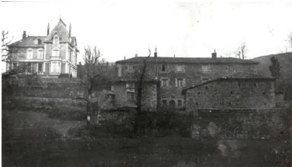
La maison 1908 au-dessus de la ferme (1908).