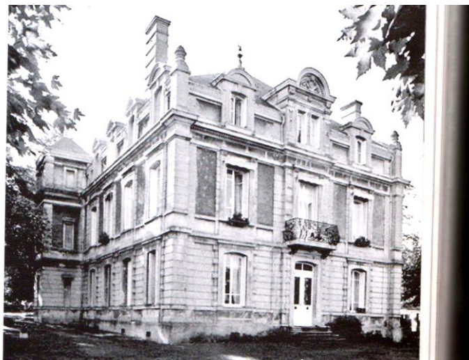
Façade sud du château