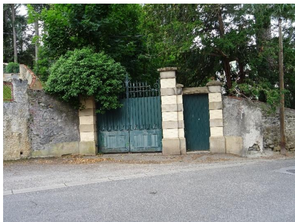
Ancienne entrée sur la rue Michel Laval

Le bâtiment a sans doute été édifié vers 1840, puis transformé. Il a une allure plutôt urbaine par son style et son gabarit. Il est construit selon un plan massé carré, élevé sur deux niveaux surmontés d'un étage en mansarde qui comporte 3 lucarnes. Cette disposition se retrouve sur 3 côtés de l'édifice. Une partie du bâtiment plus ancien qui devait appartenir à l'atelier d'extraction de la carrière a été conservé adossé à la droite de la maison. On peut observer les restes supérieurs de ses grandes ouvertures