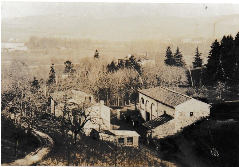
L'atelier de la carrière

Cette fabrication fut reprise par Alexis Massenet et David qui installèrent une fabrique de faux en face de la future caserne Grouchy 1 .