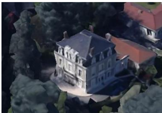
Vue aérienne actuelle