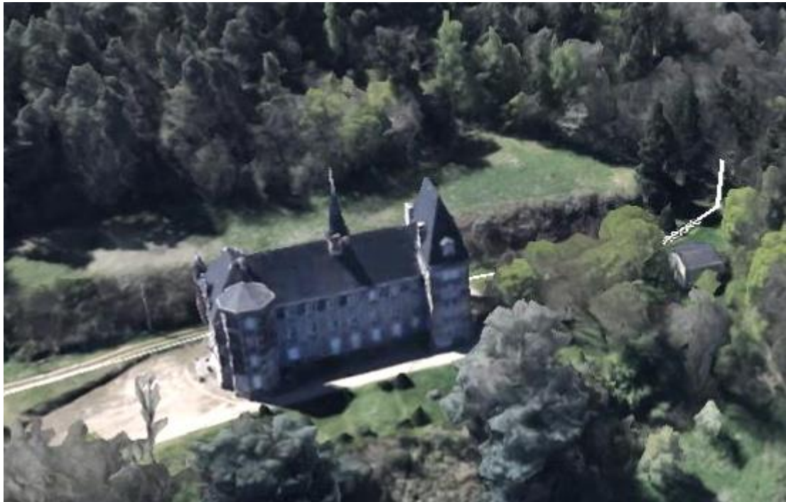
Le château dans son cadre forestier