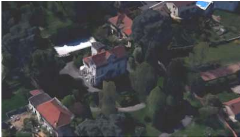
La maison avec un plan en L. Bâtiment annexe perpendiculaire au dessus