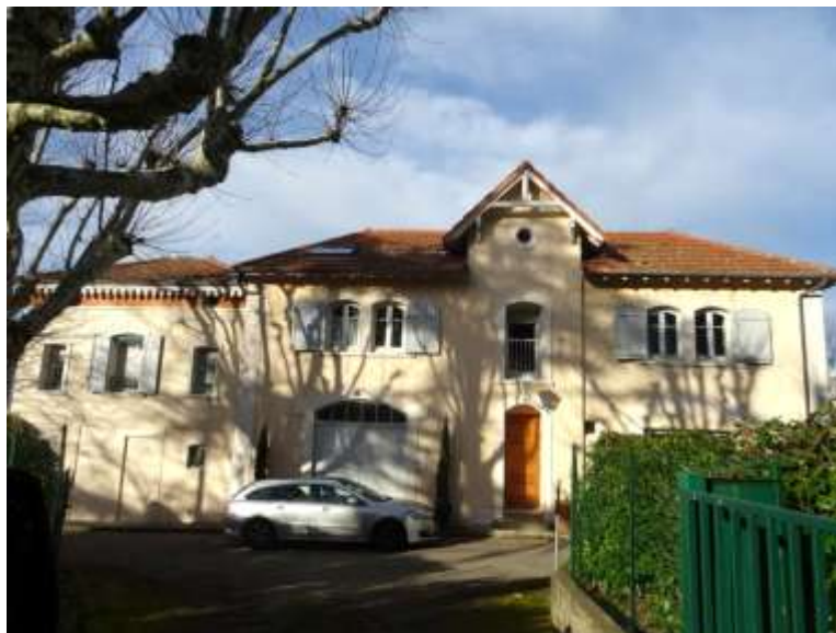
Maison de gardien

Les bâtiments annexes qui subsistent présentent une qualité d'architecture remarquable.