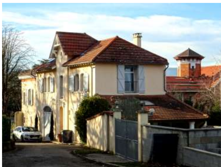
A l'arrière de la maison, bâtiments de ferme surmontés d'une tour octogonale