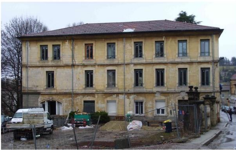
Le bâtiment en cours de restauration

La photo montre l'ampleur des dégradations qu'a subies le bâtiment. La toiture en ardoise avec ses chiens assis à lucarnes a été remplacée par un toit à tuiles banal. Les bâtiments des écuries qui faisaient face au château ont été détruites. On a du mal à imaginer le charme ancien du château !