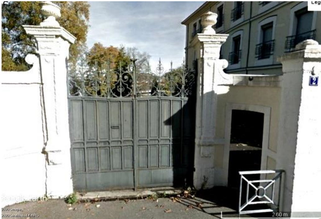
Le portail d'entrée orné de piles surmontées de vasques a été restauré