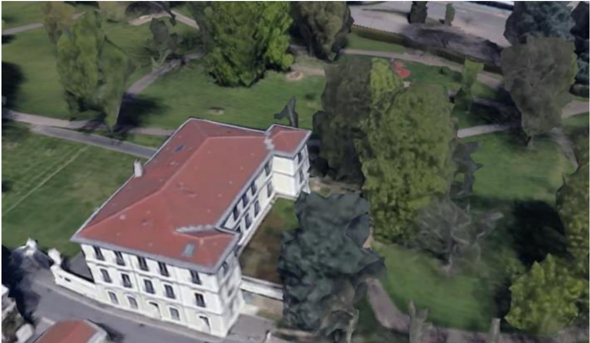
Vue aérienne montrant la façade sur rue et la façade arrière : celle-ci présente un corps central encadré de deux corps avancés