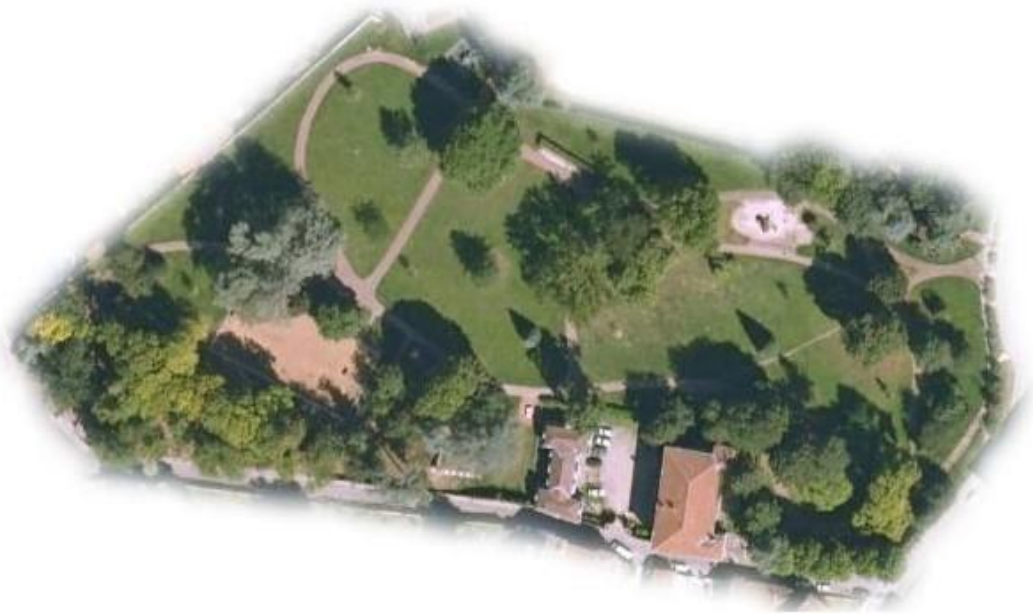
Le château dans son parc

Victime d'un incendie en 1940, le château perdit sa tourelle d'angle et son toit pentu. Laisse sans entretien pendant plusieurs années, il connût également des dégradations. Les écuries ont été démolies en 2007. Il a été restauré après 2009.