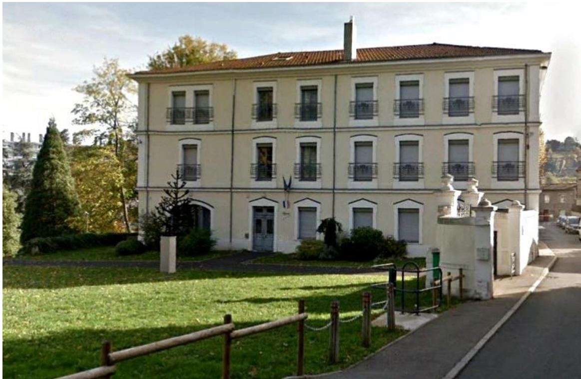
Le bâtiment après sa restauration.

La photo montre l'ampleur des dégradations qu'a subies le bâtiment. La toiture en ardoise avec ses chiens assis à lucarnes a été remplacée par un toit à tuiles banal. Les bâtiments des écuries qui faisaient face au château ont été détruites. On a du mal à imaginer le charme ancien du château !