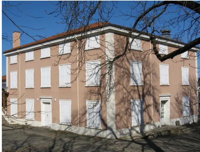
Maison Guitton à Villars

On ne connaît pas l'architecte qui a réalisé cet édifice. Les bâtiments sont conçus de façon très simple, sous la forme de parallélépipèdes austères. Les façades sont sans ornements. Il y avait également une chapelle.