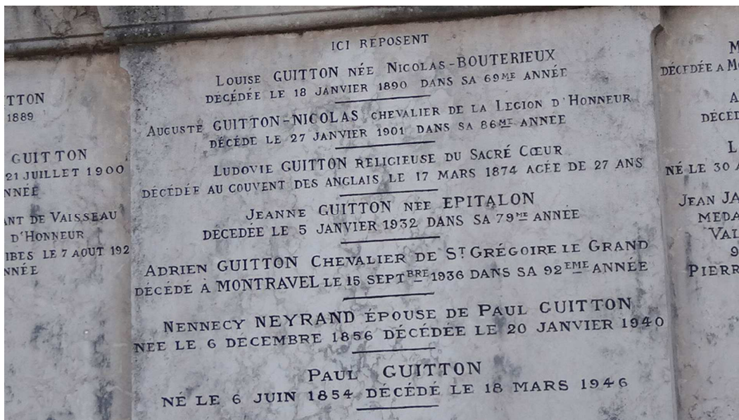
Sépulture de la famille Guitton à Villars

Après la disparition de l'entreprise Guitton, le ministère de l'Agriculture a acquis la propriété de Montravel pour en faire un lycée agricole en 1963.