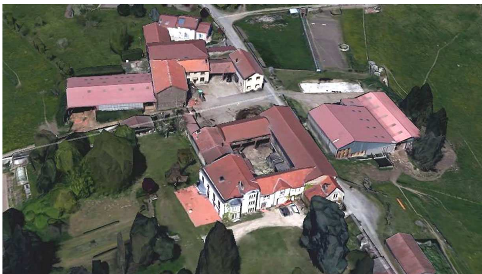
Une composition en quadrilatère présentant une belle façade ouvrant sur le parc

Le bâtiment principal est sans doute assez ancien. D'après J. Sagnard, il remonterait en partie aux XV ème et XVI ème siècles.