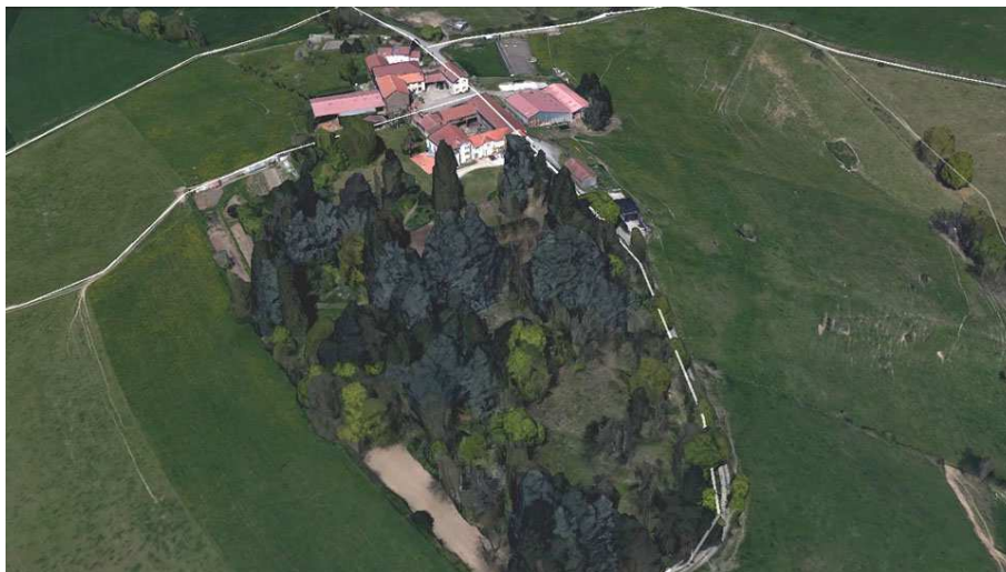
La propriété et son vaste parc

Il s'agit d'une maison de maître située à l'écart, au sud du bourg, dominant les communes de La Fouillouse et de L'Etrat, avec des bâtiments agricoles associés.