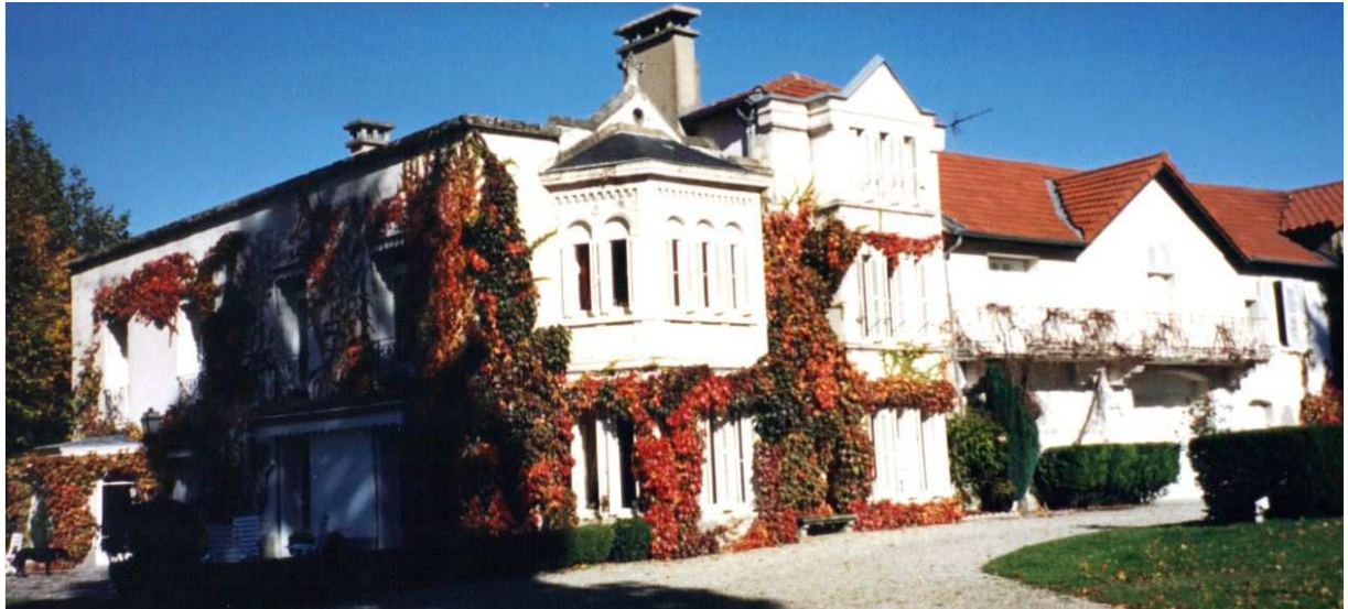
La façade sud vers l'an 2000.

Il semble bien que l'ensemble ait été édifié en plusieurs phases, chacune des parties offrant un style différent. Il est ainsi difficile d'attribuer un style à l'ensemble.