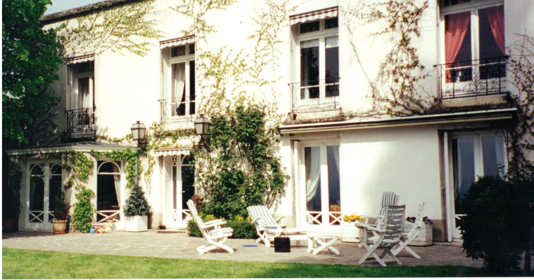
La façade ouest retraitée a un charme certain

A présent, les façades des bâtiments ne sont pas en très bon état et auraient besoin d'être rafraîchies.