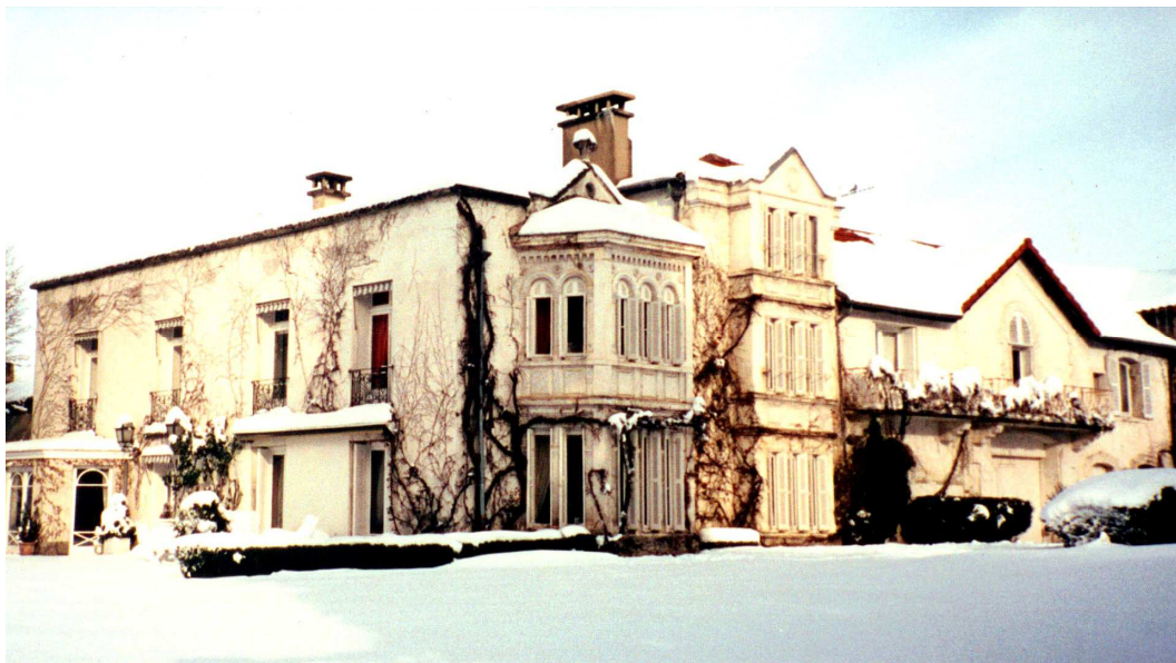
Les façades ouest et sud

La façade ouest avait été traitée beaucoup plus simplement, sans relief apparent. La famille Thiollier lui avait accolé un édifice en bois qui permettait d'accéder directement au 1 er étage et qui masquait le niveau du rez-de-chaussée. On aperçoit son extrémité sur le cliché où figure la famille Thiollier (cf supra).