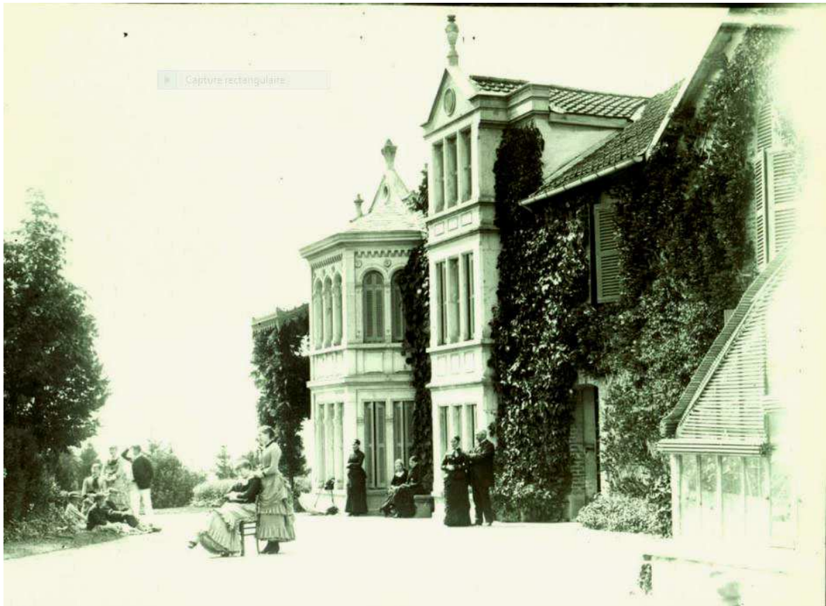
La façade sud de la villa avec la famille Thiollier

Un premier bâtiment, implanté en avancée, correspond sans doute aux pièces les plus prestigieuses. Il offre une belle façade de 3 niveaux, dotée d'une composition dissymétrique, avec une avancée en bow-window par rapport à la partie centrale. Celle-ci développée sur 3 niveaux est couronnée d'un