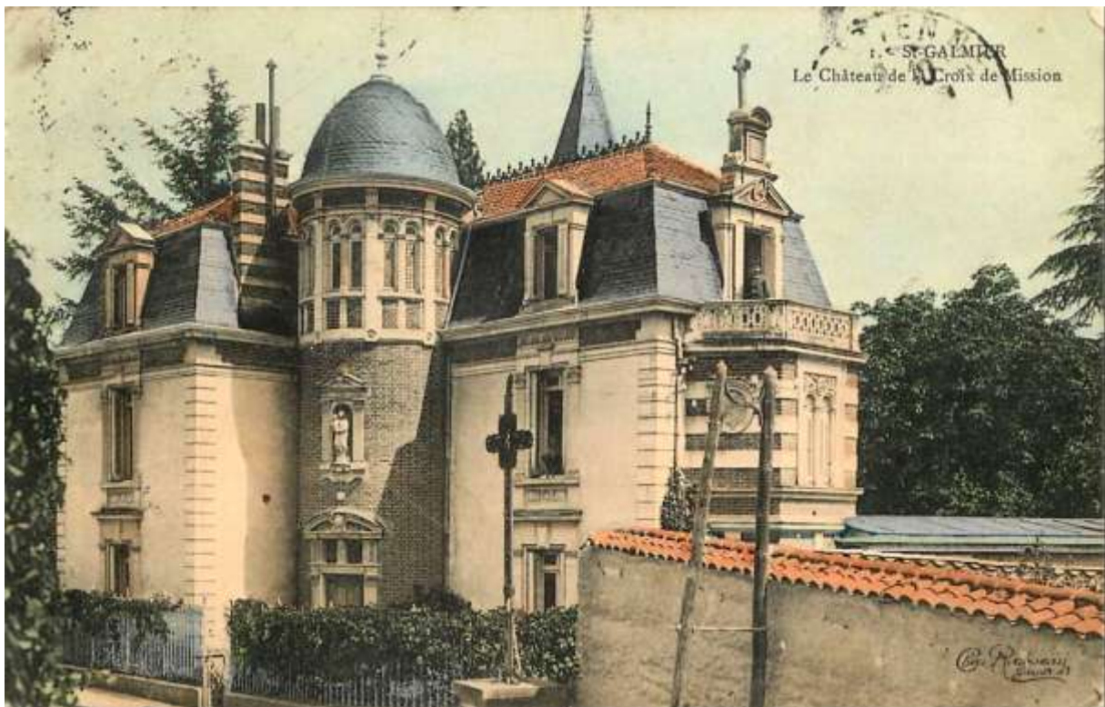
Vue ancienne vers 19210 avant l'agrandissement

Sa composition est complexe. Pour la façade sur rue, on remarque la présence d'une tour couverte d'un dôme. A l'intérieur de l'arrondi de cette tour se trouve des pièces rondes. Cette tour sert de rotule entre deux corps de bâtiments qui ne sont pas implantés dans le même plan et sont en décrochage. Leurs gabarits et le style sont aussi représentatif du style 3 e République : volumes assez carrés, sur 2 niveaux, plus mansarde percée de grandes lucarnes surmontées de frontons triangulaires. La toiture en ardoise est agrémentée de cheminées et d'épis de faîtage.