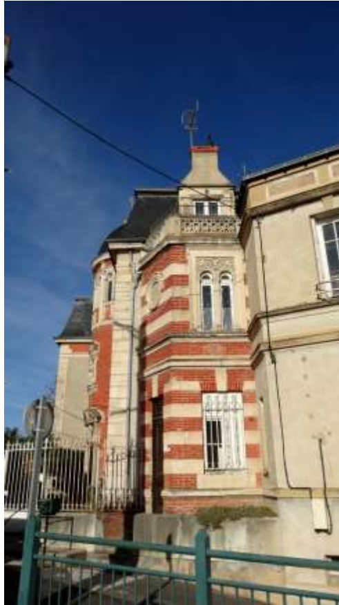
Façade sur la place