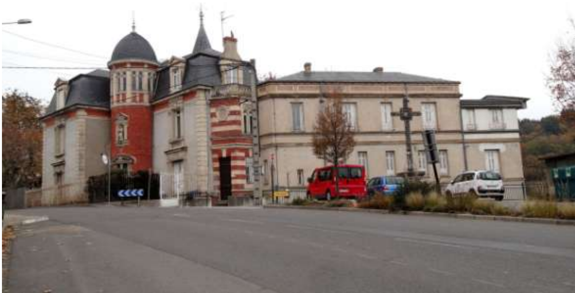
Vue d'ensemble : bâtiments anciens et aile plus récente

La tour centrale offre une composition décalée par sa forme et par sa décoration. A l'étage, le dôme est soutenu par une sorte de lanterne à arcades géminées qui évoque une architecture d'église. Cet étage constituait en fait l'arrière de la chapelle logée à ce niveau. Une niche surmontée d'un fronton triangulaire et encadrée de pilastres abrite une vierge. La porte d'entrée au pied de la tour est surmontée par une lucarne à deux fenêtres, encadrées par des pilastres richement décorés. Ils supportent un fronton en demi-cercle brisé, orné d'armoiries et de motifs en feuillages.