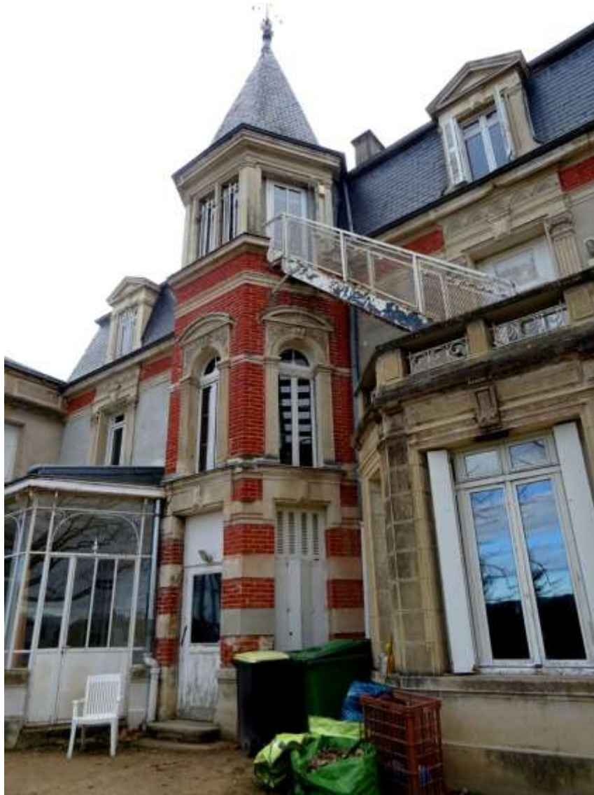
Vue de la façade sud. Belle tour à toit clocher Diversité et richesse des encadrements.