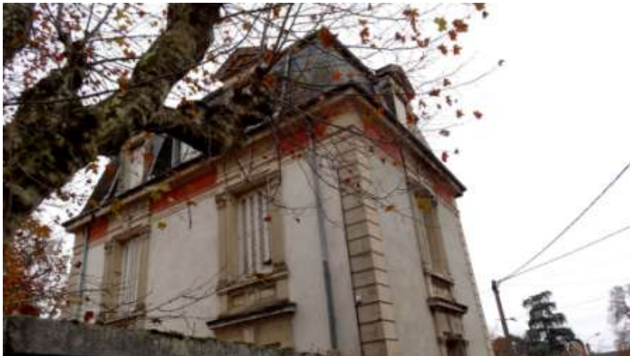
Éléments de façade arrière