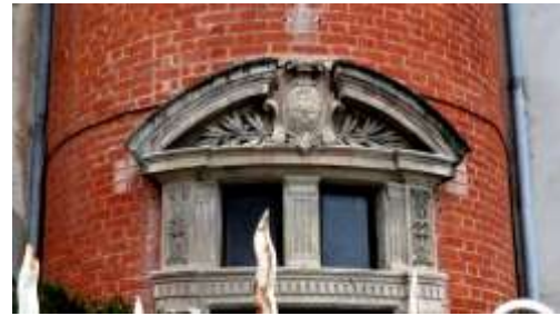
Fronton circulaire brisé